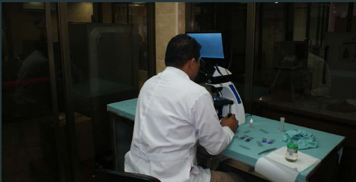
Laboratorio de citogenética del Hospital Infantil con especialista

contando para su ejecución, seguimiento y evaluación con el MINSA, ASNIC y DECCO Internacional. El número de beneficiarios atendidos se elevó a 15.300 titulares de derechos, cien más de los que teníamos previstos, entre niños/as con malformaciones congénitas y personal responsable, obteniendo una mejor atención sanitaria y un mejor conocimiento de sus derechos como personas con discapacidad y familiares para conseguir una mejor calidad de vida.