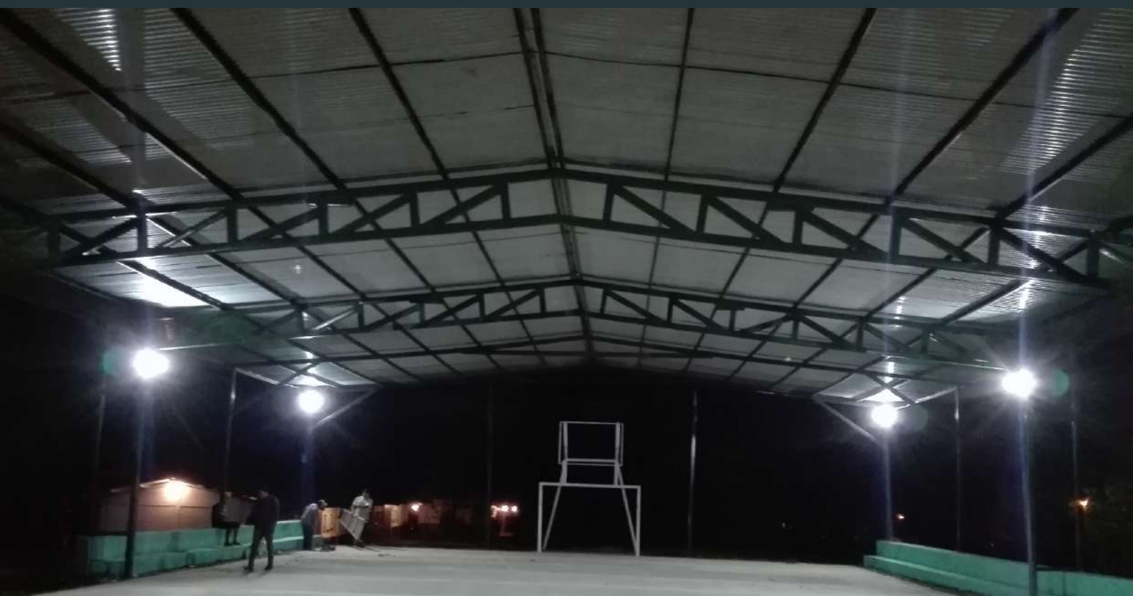
Vista del pabellón deportivo cubierto.

dos en torno a las infraestructuras del centro. Éste proyecto está financiado por la Excm. Diputación de Sevilla, en su convocatoria del 2017. Por otra parte, a finales de 2019 se aprueba el proyecto de la construcción de un comedor y un aula de clase así como su equipamiento en el mismo centro escolar.