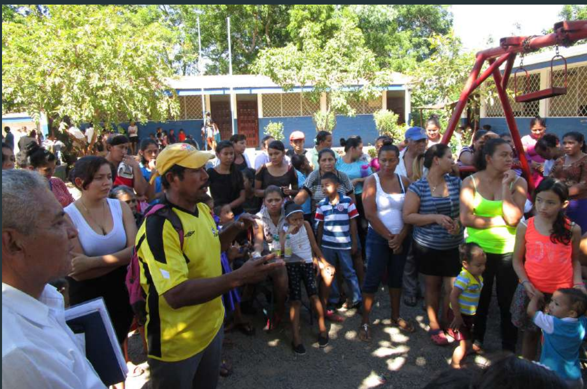
Asamblea elección Comité de Agua y Saneamiento (CAPS)

Así mismo los destinatarios se beneficiaron de un proceso de formación en Gestión y Administración de Recursos, Mantenimiento de Agua, Salud y Medio Ambiente, Género y uso de Letrinas. En todo momento se contó con el apoyo de instituciones tales como la Alcaldía de El Viejo, el Ministerio de Salud y el Gabinete de la Comunidad y la Vida (éste último como garante de su voluntad y soberanía) para su correcta ejecución.