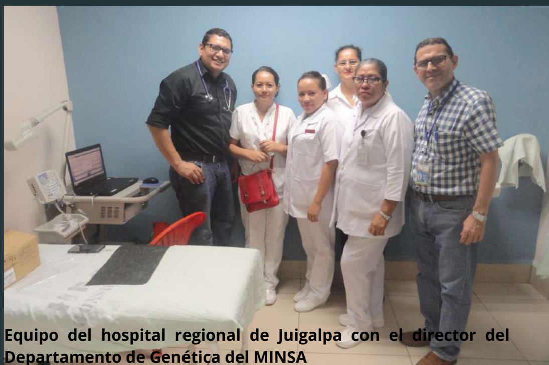
Equipo del hospital regional de Juigalpa con el director del Departamento de Genética del MINSA

sistema sanitario nicaragüense al reforzar la coordinación de 19 hospitales regionales y departamentales con el hospital infantil y los SILAIS a través de un servicio de atención para los menores con discapacidad y sus familiares, fortaleciendo también la condición de las cuidadoras al mejorar su autonomía gracias a un ahorro en costes, información sobre recursos de apoyo social y reconocimiento de derechos sociales e individuales. El número de beneficiarios atendidos fue de 5.849 hombres y 13.647 mujeres.